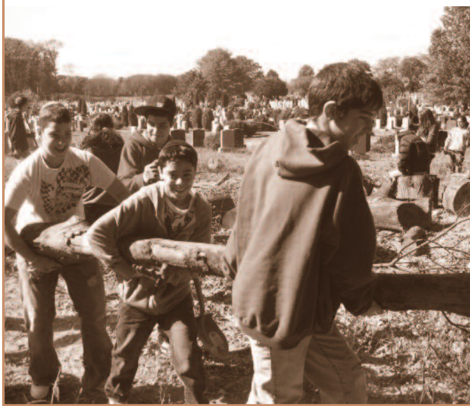
Mount Richmond Cemetery after the February 2010 blizzard